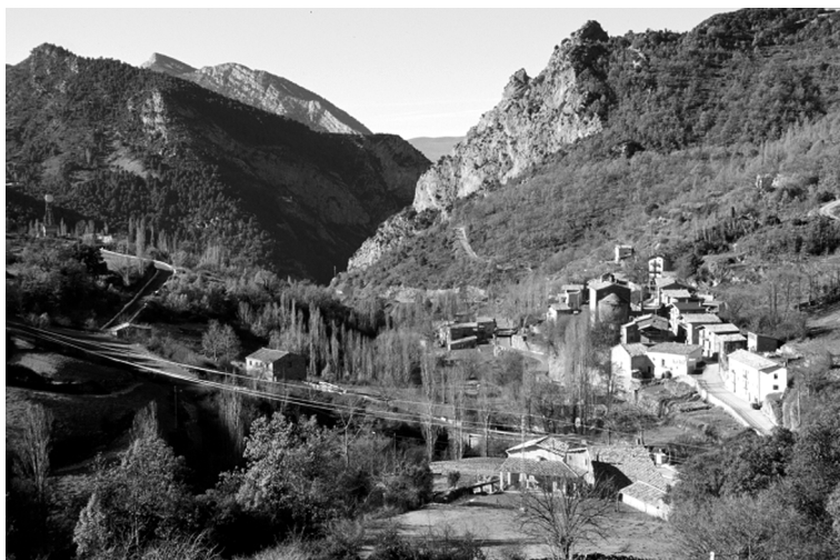
FIGURA 7. El nucli d'Alinyà, a l'indret més obert i més ben comunicat de la vall.

Sant Llorenç de Morunys, Solsona i Torà), i Perles i Alinyà formaven part de la de Solsona. Sobre tots dos llocs, el senyor tenia plena jurisdicció civil i criminal. 41