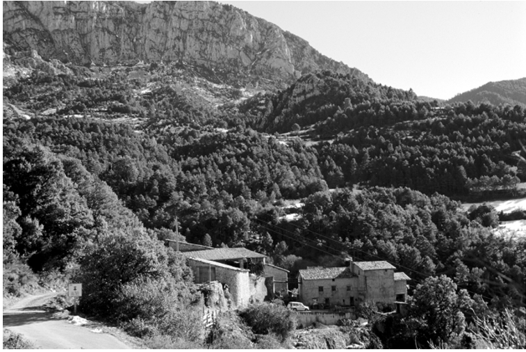
FIGURA 4. Cal Graell, al sector central de la vall d'Alinyà. Al fons, les cingleres dels Castellars.