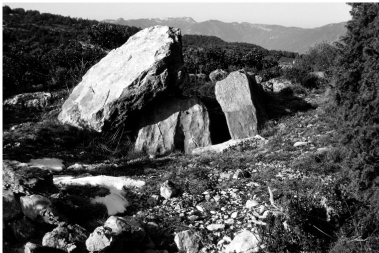
FIGURA 2. Dolmen de coll Durau.

Cerdanya fins al Montsec, constitueix un dels grans focus de localització d'aquest tipus de jaciment prehistòric dins el marc del Principat. Des d'aquesta perspectiva, el dolmen de Coll Durau significa la confirmació de la vall d'Alinyà com una de les «peces integrants» del continuum territorial que representava la civilització megalítica dins el Pirineu nord-occidental català.