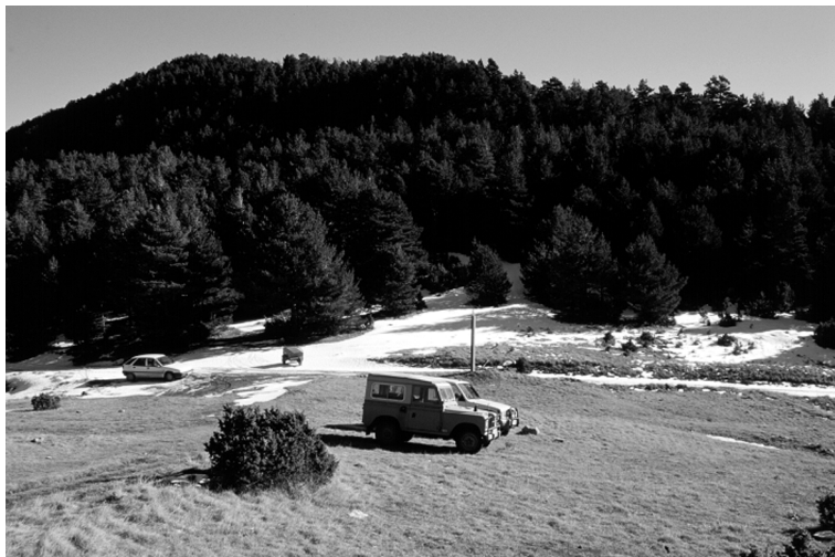
FIGURA 8. El coll d'Ares, lloc de pas d'importància pretèrita i situat en un dels punts més boscats de la vall.

tari a pesar dels canvis de titularitat que la finca ha tingut al llarg del segle xx. En aquest sentit anotarem que, després de la casa de Medinaceli, els propietaris han estat, successivament, la raó social Papelera Ibérica, SA, un comerciant de fusta de Solsona i, finalment, la Fundació Territori i Paisatge de Caixa de Catalunya.