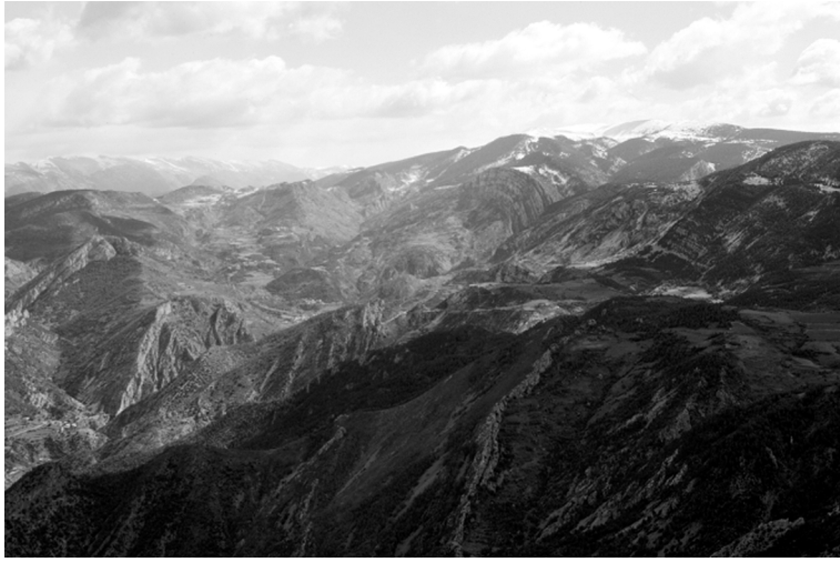
FIGURA 1. Visió general de la vall d'Alinyà, amb el massís de Port del Comte al fons.

la vall es desenvolupa íntegrament dins els contraforts ponentins de Port del Comte (figura 1), un dels massissos més ben individualitzats dins el sector occidental dels Prepirineus catalans (Solé, 1958). De fet, el seu caràcter abrupte i trencat i la importància dels desnivells en el pla intern —que va dels 625 m en el punt més baix, als 2.382 m en el més elevat—, 5 malgrat l'extensió relativament petita de la demarcació, són trets que podem considerar típicament definatoris del muntanyam prepirinenc.