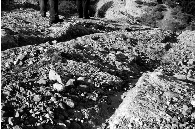
FIGURA 5. Un detall de les roderes o 'trilles' de Clarià, probable testimoni de l'antiga explotació forestal.

Clourem aquest apartat assenyalant que alguns autors (Iniesta et al. , 1991) apunten la possibilitat que la concentració de rais i de raiers a Coll de Nargó (considerada històricament com la capital raiera del Segre) sigui un reflex de la intensitat que l'explotació forestal va assolir en determinats moments a la rodalia d'aquesta població, i sobretot als boscos de Perles i d'Alinyà. 35 Possiblement l'estudi aprofundit d'aquesta activitat, en el futur, permetrà aclarir molts dels interrogants plantejats.