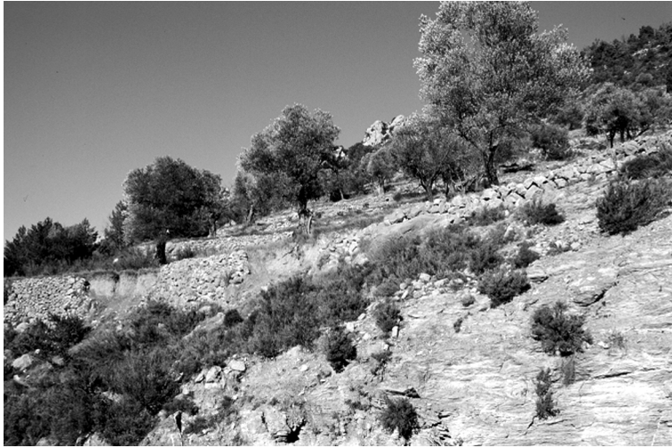
FIGURA 10. Oliveres al pla de Perles. A pesar del nom, és un indret topogràficament molt trencat.

roca del Solà. Malgrat que es tracta d'un coster molt pendent (o sigui, que no té res de pla), tot ell és abancalat i ple d'oliveres (avui, majoritàriament, abandonades). Pensem que és una magnífica mostra de les condicions topogràfiques generals de la vall i de la dificultat que havia representat, històricament, l'ocupació agrícola del sòl (figura 10). En aquest context, l'aplicació del terme pla té unes connotacions que, a criteri nostre, són expressives per si mateixes.