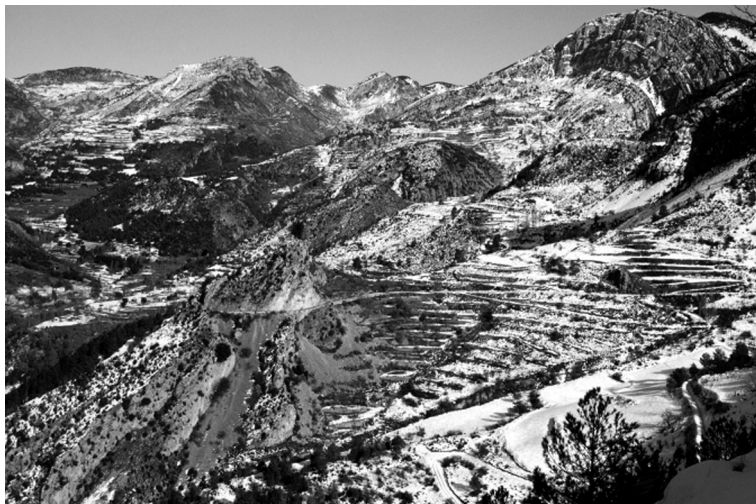
FIGURA 9. L'indret de Colldeboix, un dels assentaments de població antics del terme d'Alinyà.

un nom que té relació amb la vall d'Alinyà només indirectament. En realitat, es tracta d'un assentament de població que pertany al municipi de la Vansa i Fórnols, veí del d'Alinyà, i que ha donat origen al nom del curs fluvial que delimita pel nord el nostre terme. 54