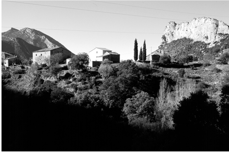
FIGURA 3. Veïnat de Perles. A l'esquerra, el cogulló de Turp; a la dreta, la roca de Perles.

den haver estat fonamentals: la relativa proximitat de la nostra demarcació al curs del Segre (via de comunicació clau d'aquesta part del país, en el sentit nord-sud, ja a l'antiguitat) i la possibilitat que, com a vall secundària o lateral (i situada prop de dos congostos importants d'aquell riu, com són el de Trespunts i el Grau d'Oliana), exercís un paper significatiu en les comunicacions transversals (o sigui, en el sentit est-oest). Algunes interpretacions històriques (particularment Vilar, 1964) han fet èmfasi en aquests dos factors i els han considerat fonamentals a l'hora de valorar, en una perspectiva cronològica, el paper exercit pels Prepirineus en relació amb el conjunt català. Vegem-ho, concretament, en aquestes dues reflexions: 21